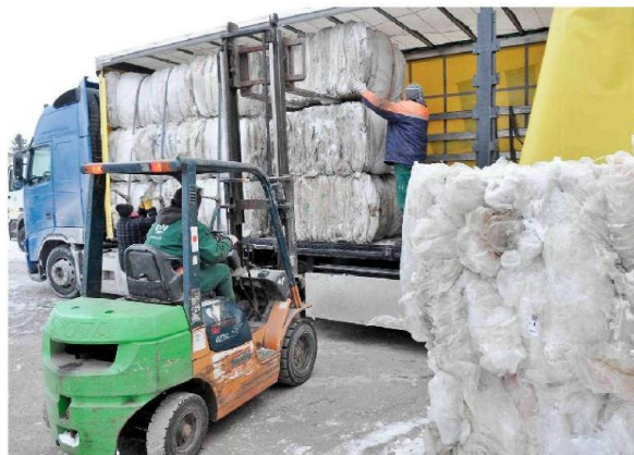
Supresuoto polipropileno, kurio vienas pakas sveria apie 350 kg, šiomet jau buvo išvežta 20 tonų. Dabar ruošiamas naujas antrinių žaliavų-polipropileno - krovinys, kuris iškeliams į Lenkiją.